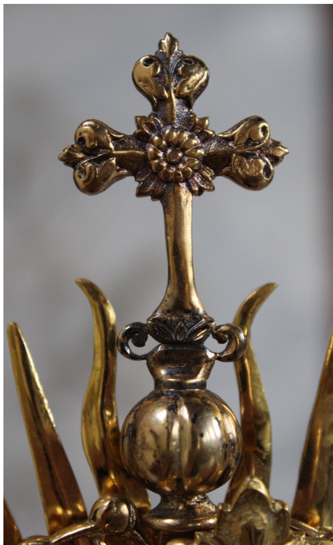
Schweidel József keresztje

Demeter Zsófia történész ajánlása a metodikai segédanyag elején is olvasható: „...vidékünk fontos örökségének négy intézményét, a kápolnásnyéki Vörösmarty Emlékházat, a gárdonyi Gárdonyi Emlékházat, a pákozdi Katonai Emlékpark-Nemzeti Emlékhelyet és a kápolnásnyéki Halász-kastélyt fogja össze a Hazáért körút egy tematikus emléktúra keretében. Az pedig, hogy mindez egynapos iskolai kirándulás keretében történik, igazi telitalálat. A bicikli bevonása, a sza-