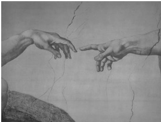
a) Michelangelo Buonarotti: Ádám teremtése (részlet) (1508-1512)

Határozza meg, milyen stílusirányt vagy kort képviselnek ezek a művek! Töltse ki a táblázatot! (Csak helyesen kitöltött oszlopok kapnak pontot. A stílusirány vagy kor megnevezése egy-egy pontot, a pontosan kitöltött oszlopok egy-egy pontot érnek.)