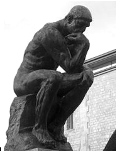
b) Auguste Rodin: A gondolkodó (1880)