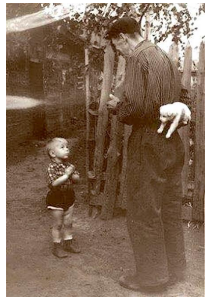
Néhány másodperccel a boldogság előtt ~ 1955

A fotósorozat képei egyenként legfeljebb 150 KB méretű jpeg állományok legyenek, a munkanaplót egy darab, legfeljebb 500 MB méretű pdf fájlban, a filmetűdöt egy darab legfeljebb 650 MB méretű mp4 formátumú videoállományban készítse el.