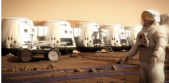
La future base habitable en image de synthèse (Mars One)

Pour pouvoir participer au projet, l’entreprise fait une interview en ligne dans laquelle vous devez répondre aux questions en 350-400 mots en tout :