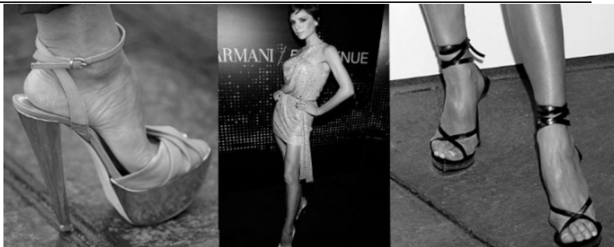
Victoria Beckhamet meg kéne műteni