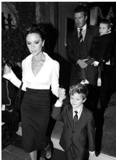
A Beckham család karácsony este vendéglőbe megy