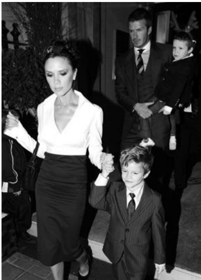
A Beckham család karácsony este vendéglőbe megy