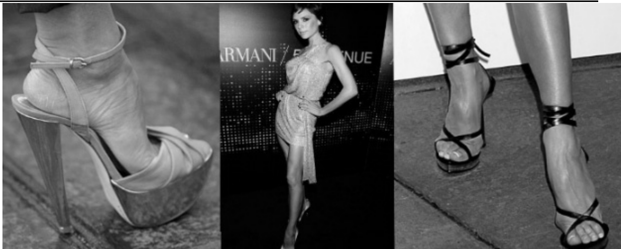
Victoria Beckhamet meg kéne műteni