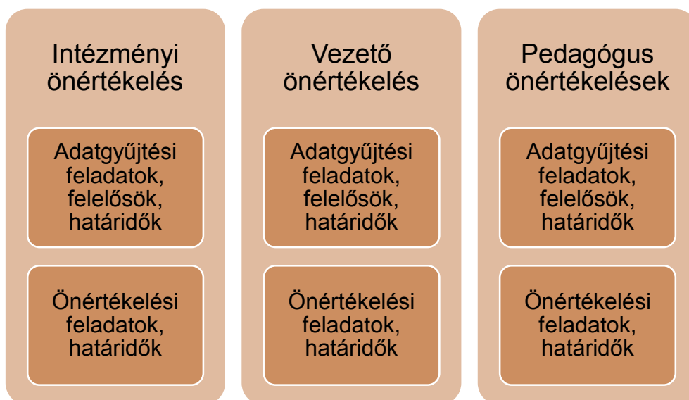
5. sz. ábra. Az éves önértékelési terv ajánlott szerkezete

Az éves önértékelési tervben szereplő határidőket, felelősöket az intézményvezető vagy a nevelőtestület erre kijelölt tagja rögzíti az Oktatási Hivatal által működtetett informatikai felületen, amely a tervben rögzítettnek megfelelően teszi elérhetővé az adatgyűjtő és az értékelő funkciókat az értékelésben részt vevők számára.