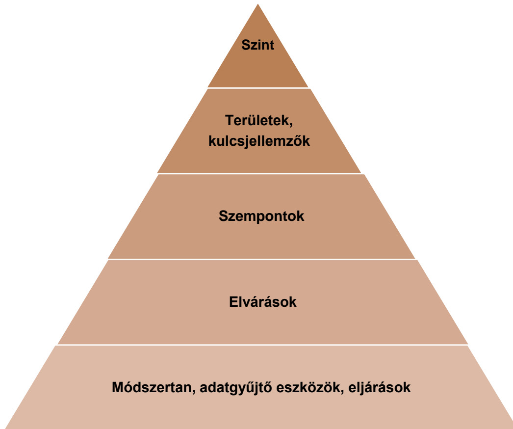
2. sz. ábra. Az önértékelési standard szerkezete