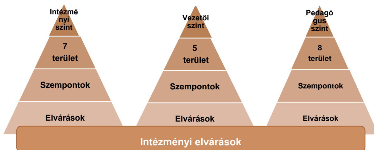
3. sz. ábra. A standard elvárásainak és az intézményi elvárások viszonya

alkalmazott gyakorlatokra és módszerekre épül, így az értelmezésbe ebben a szakaszban már be kell vonni a nevelőtestületet.